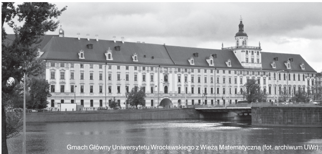
Gmach Główny Uniwersytetu Wrocławskiego z Wieżą Matematyczną